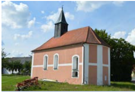
Bild: Filialkirche Effenricht

che St. Dionysius mit ihrer Ausstattung, die um 1720 erbaut worden ist.