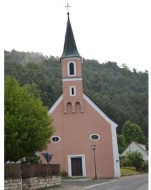
Bild: Filialkirche St. Sebastian

Auf der „Ziegelhütte“ ist es das Haus Nr. 9, die Kath. Filialkirche St. Sebastian“, erbaut in den Jahren 1689/90 mit seiner gefälligen barocken Innenausstattung.