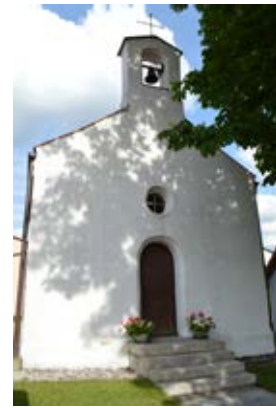
Bild: Marien- kapelle Hitzendorf

Ist es die um 1855 erbaute Marienkapelle mit dem Glockentürmchen und der Innenausstattung.