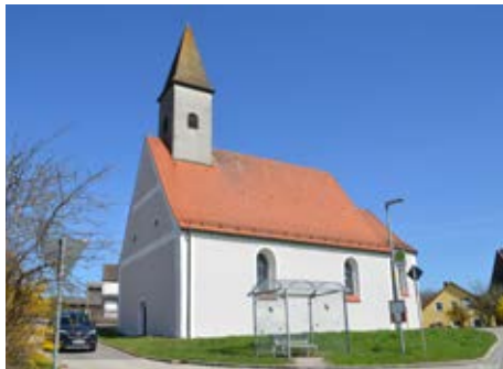
Bild: Dreifaltigkeitskirche Granswang

Ist es die katholische Filialkirche „Heilige Dreifaltigkeit“, ein Bau aus dem 15. Jahrhundert, verändert im 17. Jahrhundert, dazu noch mit einem Dachreiter, der nach 1900 dazukam.