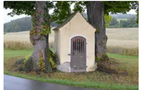
Bild: Bayerische Kapelle

Dann ist zu nennen die Kath. Kapelle „Hl. Dreifaltigkeit“, die sogenannte „Bayerische Kapelle“ oder „Kammerkapelle“ aus dem 18./19. Jahrhundert.